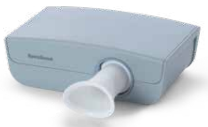
Spirometro a ultrasuoni SpiroScout SP plus